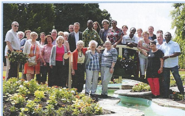
Les membres d'Asfodevh et la délégation du conseil municipal de Cormelles-le-Royal