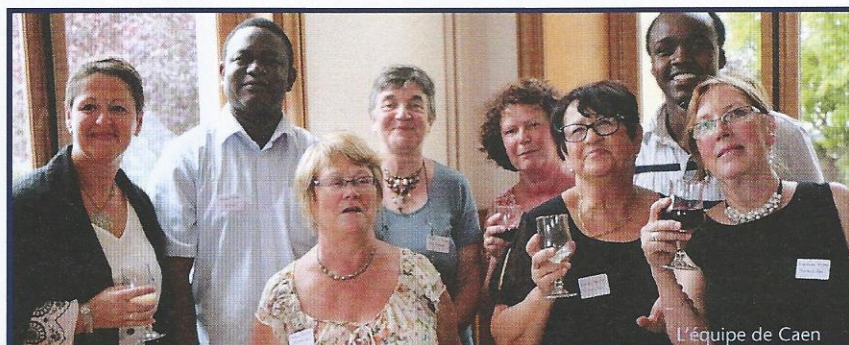
L'équipe de Caen