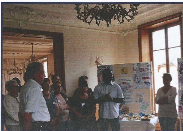
Réception du conseil municipal de Cormelles-le-Royal