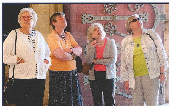
À la découverte de Caen