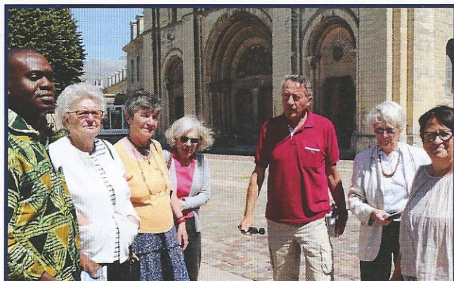
Balade à Caen

le conseil d'administration et la cellule France d'Asfodevh